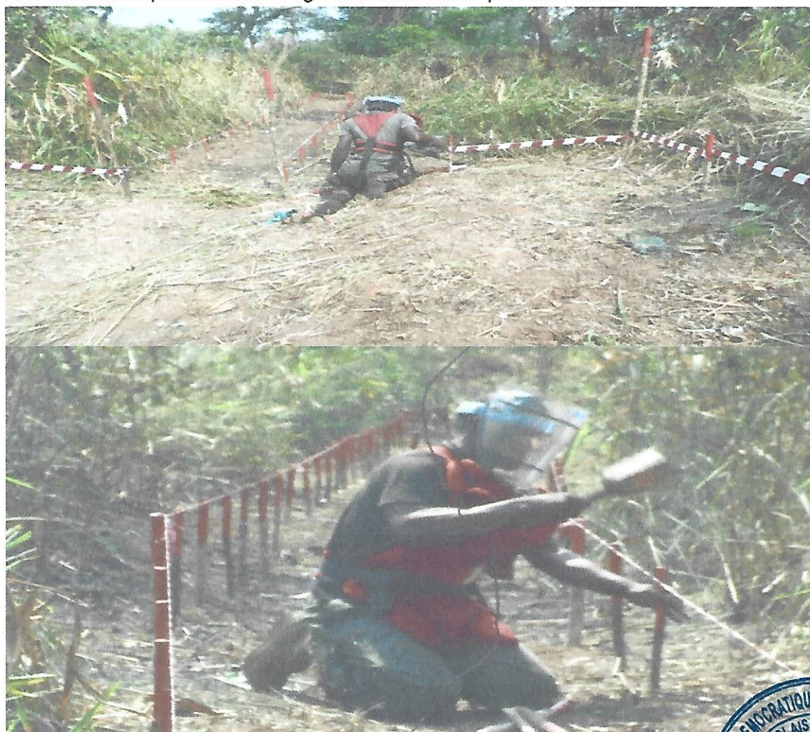
Photo illustrative opération de déminage manuel à KABALO par l'ONG DCA

Outre les objectifs réalisés, la RD Congo compte finaliser avec les objectifs restant avant les délais convenus.